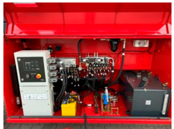
Sistema de diagnóstico a bordo